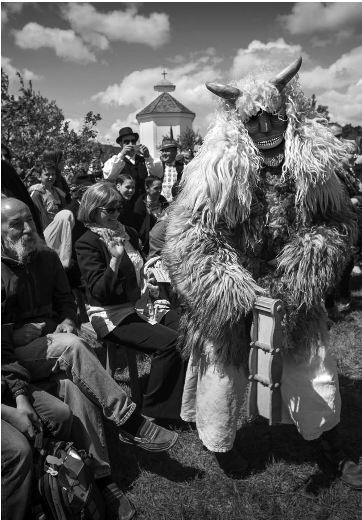
Mohácsi busók a Múzeum Örökség fesztiválján