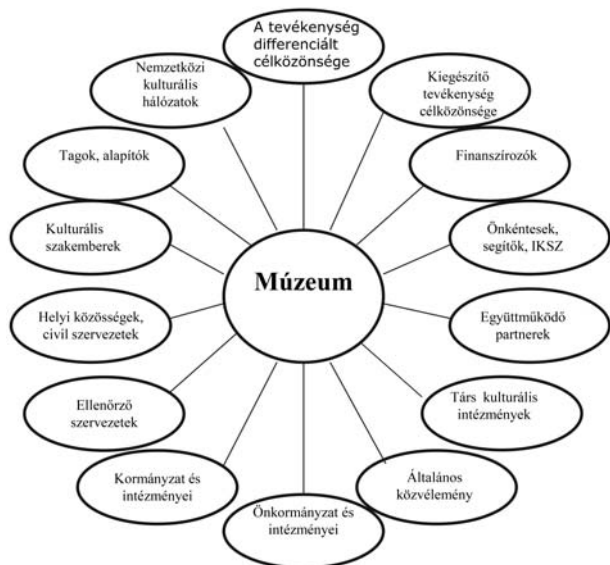
3. sz. ábra. Az érintettek köre (saját szerkesztés)