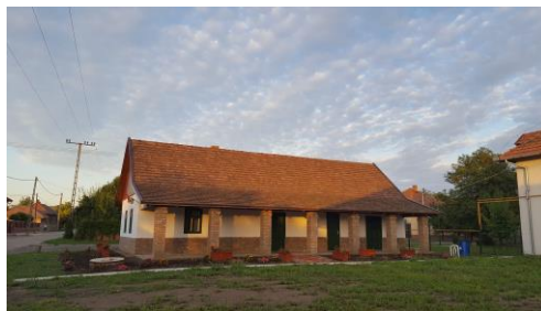
A néprajzi gyűjteménynek helyet adó épület

A közel múltban átadott, Békésszentandrás néprajzi gyűjteményének helyet adó épületben olyan dokumentumok, fotók és tárgyi eszközök találhatóak, melyek településünk hagyományaira, az egykori foglalkozásokra, a szőnyegszövésre és a kubikos munkára utalnak.