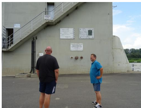
A vitéz Horthy István Duzzasztómű mellett

A találkozó első részében a gátórházat tekintették meg, majd a bent található dokumentumok következtek. Sok-sok évre visszamenően megvannak a vízügyi feljegyzések a vízszintmérésekről, a gátak állagának jelentéséről szóló jegyzőkönyvek illetve a gátakon végzett karbantartási és javítási munkákról, melyeket zömében kubikosok végeztek. A gátór elmondása szerint utóbbiból, a javítási munkákból az országos átlagtól jóval kevesebbre került sor. Ez is jelzi, hogy hajdanán a szentandrási és alföldi kubikosok milyen jó munkát adtak ki a kezükből.