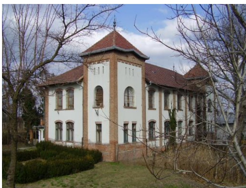
Az 1926-ban átadott központi épület