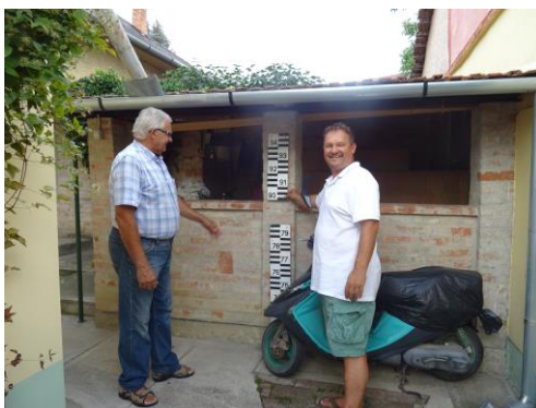
Ereklye a régi vízmérce