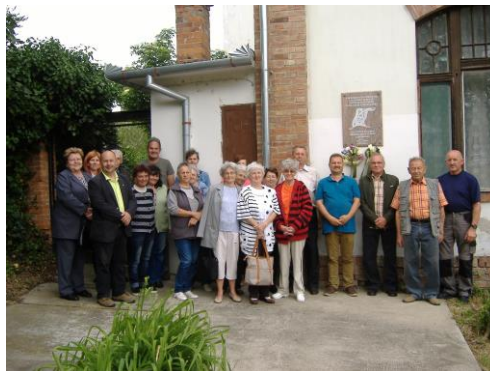
A szőnyegszövésben dolgozók tiszteletére állított tábla előtt