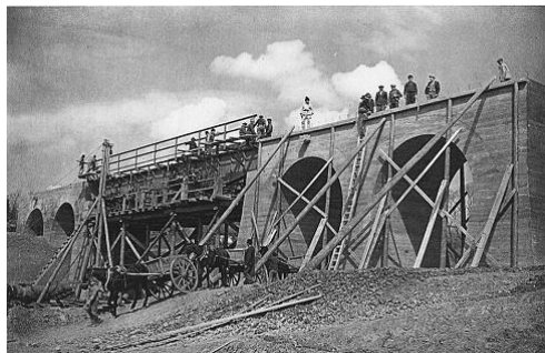
Hídépítés a Szeretfalva-Déda vasútvonalon

Az idők folyamán országos hírré tettek szert, mert munkájuk során szorgalmuk mellett a pontosság és a megbízhatóság jellemezte őket. Ezért szívesen hívták a szentandrásai kubikosokat olyan beruházásokhoz, amelyek nagyobb mértékűek voltak. Számos vízügyi beruházásnál, útépitésnél és vasútépitésnél voltak jelen. Közelebbi és távolabbi munkahelyeikre is gyalog mentek. Talicskájukat tolva, abba minden szükséges felszerelést és élelmet berakva közlekedtek. Bizony volt, amikor napokig vonultak. A munkahelyeken ideiglenes sátrakat építettek maguknak és abban töltötték az éjszakát és a pihenőidőt. Kivételes alkalom volt számukra, amikor Békésszentandráson építhették meg a duzzasztóművet. Itt összetett munkát kellett végezni, mert a földmunkán túl jelentős volt a betonozás, a vasszegecseles, a kőfaragás és kövezés is, melyekkel folyamatos összhangot alakítottak ki. Nagy ünnep volt 1942. október 15-e, a duzzasztómű átadása, amin részt vettek a kormányzón és a miniszterelnökön túl a szakminiszterek, országgyűlési képviselők, megyei főispánok, alispánok, járási szolgabírók és a kivitelező munkások és családtagjaik. Természetesen köztük voltak a kubikosok is.