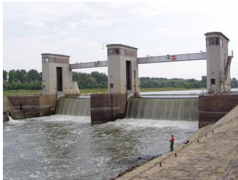
Az 1942. október 15-én átadott vitéz Horthy István Duzzasztómű

hanem az ország minden részéből jöttek. Ez az építkezés az akkori kor legnagyobb beruházása volt, ami bőven adott munkát sok-sok földmunkásnak. A kivitelezés érdekessége volt, hogy a kőműves munkák jórészt, ami elsősorban betonozásból állt, szintén a kubikos emberek végezték. Elvállaltak minden feladatot. Egyrészt a pénz miatt, másrészt pedig sokaknak ebben az időszakban közzel volt az otthona, így az éjszakákat nem kellett sátrakban tölteni, hanem haza tudott menni pihenni. Az építkezésnél a kubikosokon túl dolgoztak még vasmunkások (főleg szegecselők) és kőfaragók. Előbbiek a zsilipnél, utóbbiak a partvédelemnél játszottak fontos szerepet.