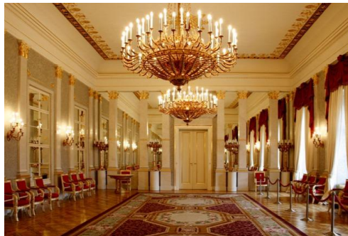
A Sándor Palotában található békésszentandrasi szőnyeg

Április 23-i látogatásunk során elmondták, hogy nem volt könnyű a tanulás, de örömmel és nagy lelkesedéssel tették, mert tudták, hogy egy feledésbe merülő szakmát tartanak életben, továbbá pedig értéket mentenek.