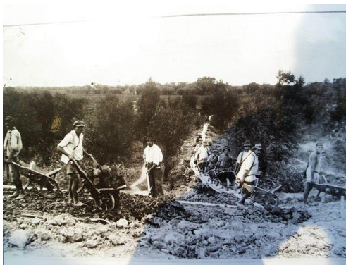
Kubikosok munka közben

Békésszentandrászt ősidők óta körül ölelte a Körös folyó, amely sűrű kiöntéseivel állandó fenyegetést jelentett az itt lakók számára. Házaikat a magasabban fekvő részekre építették, de még így is sok problémát jelentettek az árvizek. Kezdetben gátak építésével próbáltak védekezni, de az igazi megoldást a kanyarulatok levágása jelentette. Az 1800-as években két ilyen jellegű átvágás volt, melyek közül főleg a második jelentett megnyugtató megoldást, amikor a folyó távolabbra, egy kilométerre került a településtől. További biztonságot jelentett, hogy az új mederbe terelt folyót mindkét oldalról gáttal láttak el. Ezeket a munkálatokat többnyire helyi vagy környékbeli emberek végezték. Megtanulták a szakma minden fogását és un. bandákba verődve más falvakban és városokban vállaltak hasonló munkát.