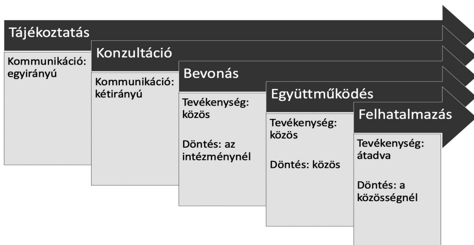
4. sz. ábra. A lehetséges részvételi szintek [Az IAP2 modell alapján saját szerkesztés] 94