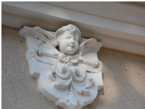
11. Nyíregyházi angyalka

„Talán észre sem vesszük őket, pedig ott vannak a régi házak oromzatán, kedvesen, vagy éppen szigorúan, figyelő és ártatlan arcokkal: angyalok, puttók, torzfejek, a letűnt korok és a jelen néma tanúi. Valamelyikük már több mint száz éve nézi az alatta elmenőket, iskolába siető gyerekeket, andalgó szerelmespárokat, fiatalokat, gondterhelt felnőtteket, ballagó néniket és bácsikat, háborús hadakat, békét ünneplőket, végignézi ahogy a gyerekből ifjú, az ifjúból felnőtt, majd öregecske lesz, és talán sóhajt egyet a nyári éjeken, amikor már nem látja többé a jól ismert arcokat, mert elköltöztek, talán egy másik országba, kontinensre, vagy megnyugodva egy másik világba... A messzi múlt ködébe vesz a szokás eredete, hogy szerencsét hozó, vagy gonoszt, bajt, balszerencsét elűző fejekkel díszítenek templomot, hajlékot. Az is lehetséges, végül már csak azért kerültek a házfalakra, mert kedvesek, szépek, vagy éppen különösek. Mainapság már teljesen kikopott ez a szokás az építészetből. Nem biztos, hogy üdvözlendő ez a váltás... Becsüljük meg tehát őket, amíg még vannak, akik vigyázó szemekkel ránk néznek Nyíregyháza régi házairól, és legközelebb emeljük fel fejünket és nézzünk fel rájuk, esetleg kacsintsunk, és az a csoda is megeshet, hogy visszakacsintanak. Ez utóbbit nem garantálhatjuk ugyan, de azt biztosan, hogy megérint minket a régi korok hangulata.”