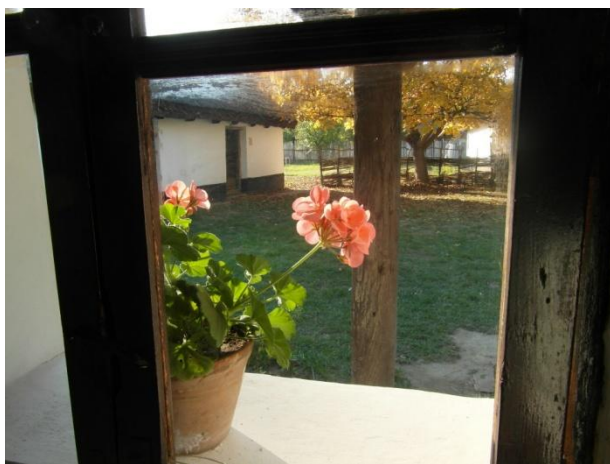
14. Őszi hangulat a Sóstói Múzeumfaluban