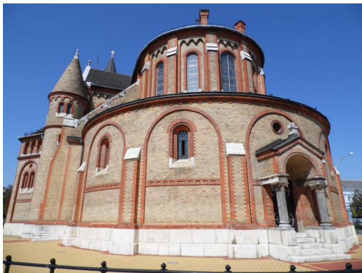
15. Nyíregyháza, katolikus templom

A többi kép az értékfeltárás során beérkezett pályamunkákból lett kiválogatva, a készítők a felhasználási jogokat átadták a TEMI Móricz Zsigmond Művelődési és Ifjúsági Ház Alapítványa részére.