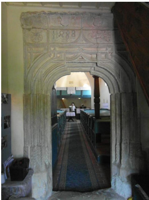
6. A közeli, nyírturai ref. templom gótikus kapuja (1488)