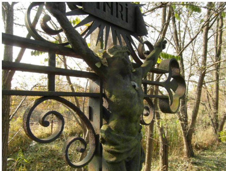
2. A szépség sokszor csak akkor válik láthatóvá, ha lehajolunk hozzá... – régi sírkereszt a Sóstói Múzeumfaluban

A múlt megbecsült értékei mellett a modern Nyíregyháza és számos értékkel, turistacsalogatóval, látványossággal szolgál az ide látogatóknak. Az Állatpark nemzetközi hírű, híres kulturális élete, színháza, fesztiváljai, mint pl. a Vidor fesztivál. Számos közösség, civil szervezet működik aktívan a városban. Az itt lakók büszkék városukra.