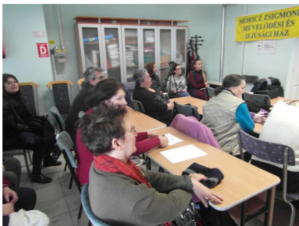
8. Szakmai találkozó a projekt keretében

2018. március végéig tartott a megvalósítás első üteme .