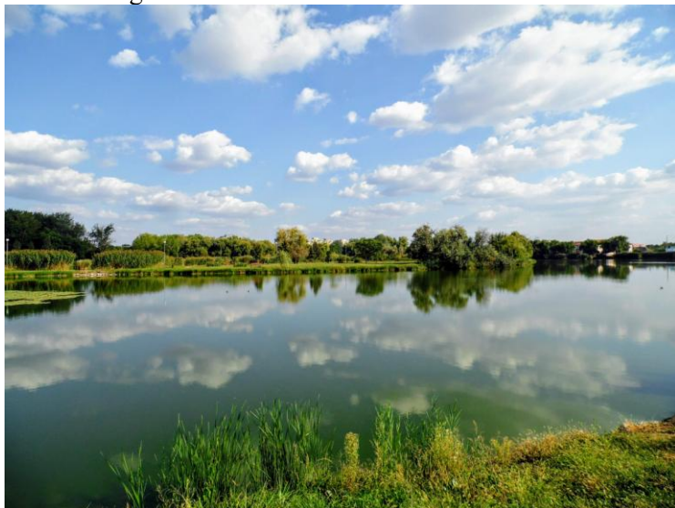
10. Önkénteseink a képzés után olcsó géppel is ilyen szép felvételeket készítettek – Bujtosi- tó

Adjunk meg minden technikai és szakmai segítséget (ahogy mi is tettük pl. adatgyűjtéssel, vagy éppen fényképezőgép kölcsönbe adásával) azoknak is, akik bár nagy tapasztalattal és szakmai tudással rendelkeznek, de idősebbek és nem igazán értik a technikai eszközök használatát. Sokan talán éppen ezért maradnak ki, hiába vannak „kincsek” a tarsolyukban, de megriadnak attól, ha egy internetes felületet, keresőt, emailt kell használni, vagy éppen egy fényképezőgépet helyesen beállítani, hogy jól működjön, és szép képeket készítsen. Számukra akár külön ismeretbővítést is lehet tartani, ahol türelmes szakemberek magyarázzák el a technikai részleteket. Akik nem tudnak jó fotókat készíteni pl. gép hiányában, ott megbízható személy esetében nyugodtan kölcsön lehet adni a szervezet birtokában lévő fényképezőt, vagy pedig egy önkéntes segítsen nekik a fotózásban.