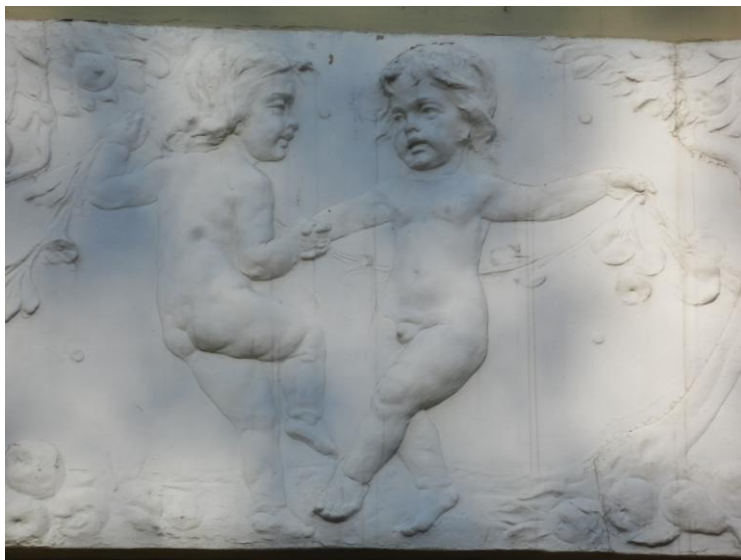
3...vagy ha éppen felnézünk rá – puttók a Benczúr tér egyik szecessziós házában

2018-ban néhány kulturális intézmény, civil szervezet és lelkes magánszemély vállalkozott arra, hogy elkezdje összegyűjteni ezeket Nyíregyházára és környékére jellemző múltbeli és jelenbeli értékeket, közösségi munkával, egymást segítve, bátorítva, kicsit szubjektív módon is, az alábbi szempontok alapján: mi a fontos a nyíregyháziaknak, mire büszkék, mi az, ami érték, de kevésbé ismert és méltó a megörökítésre és mi az, amit a város iránt érdeklődő hazai honpolgár és világutazó számára is érdemes bemutatni. Mindezt egy mintaprojekt keretében, a „Cselekvő közösségek – aktív közösségi szerepvállalás EFOP-1.3.1-15-2016-00001” központi projekt pénzügyi és szakmai támogatásával terveztük megvalósítani.