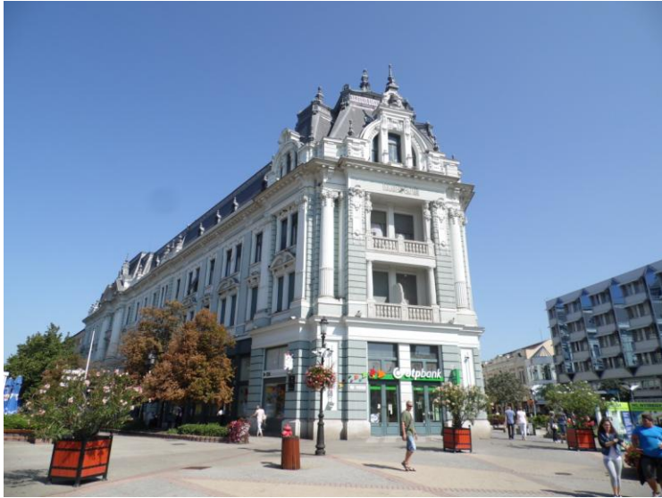
12. A nyíregyházi Takarékpálota

Az eredmények kicsit hivatalosabban megfogalmazva: