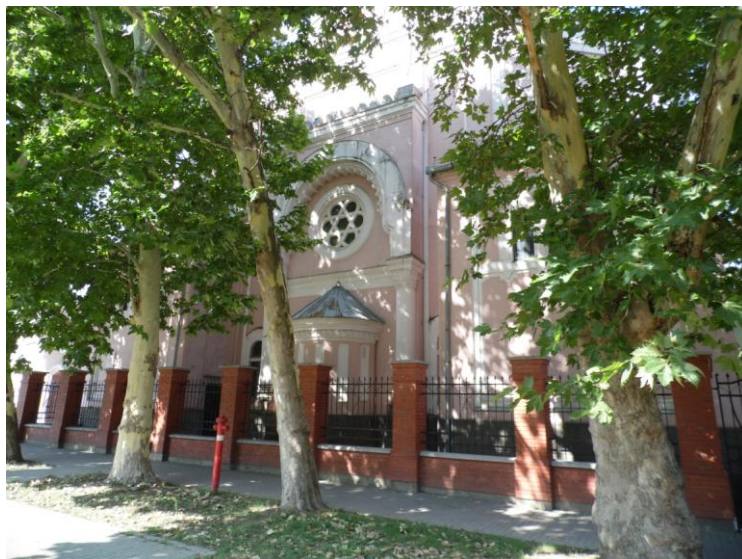
7. Zsinagóga a Mártírok terén-platánok között.

Nyíregyháza a nemzetiségek városa is egyben, hisz a roma kisebbség mellett élnek itt szlovákok (hagyományos kifejezéssel „tírpákok”) lengyelek, németek, örmények, ruszinok, ukránok. Nem etnikai kisebbségként, hanem felekezetként, de jelentős a hatásuk Nyíregyháza kulturális-szellemi életére a zsidó hitközség múltbéli és jelenbeli tagjainak is. A kulturális sokszínűség jegyében kiemelt figyelmet fordítottunk ezen kisebbségek szellemi-tárgyi örökségének és értékeinek feltárására is.